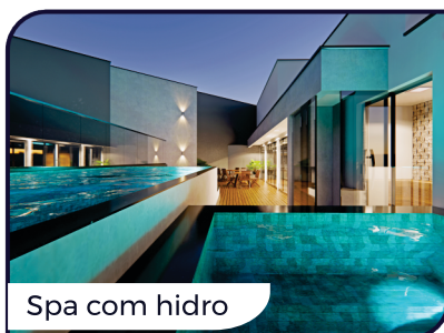
Spa com hidro