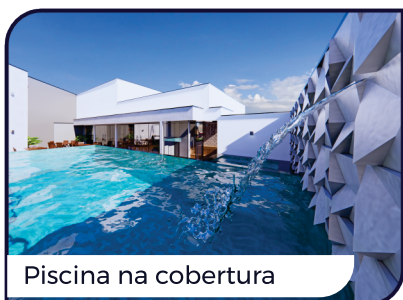
Piscina na cobertura