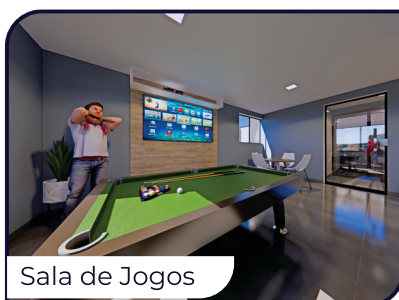
Sala de Jogos